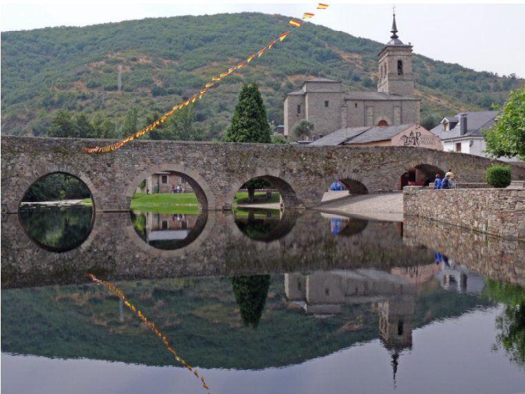
Brücke in Molinaseca