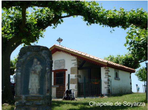
Chapelle de Soyarza